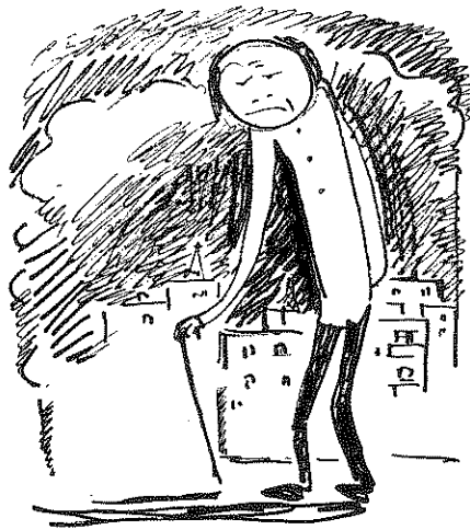
איור לשירה של לאה גולדברג "הירח הצהוב"

הטקסט והוא צייר את הרישומים לסידרת אורי-מורי ושאר סיפורי-רישום ב"דבר לילדים", הזכורים לטוב אצל כל הילדים ובני הנוער שגדלו באותם ימים. הם יצאו לאור מחדש לפני שנים מספר כספרים. נכון רשם גם אישים, שחקני תיאטרון בהצגות, ויצר שורה של רישומי-הווי נפלאים – גלויות מן העמק, גלויות מהגליל, הווי תל-אביב. במעט קווים הצליח ליצור דמויות ומראות שהציגו אופקים של אנשים, מיד יכולת להבדיל בין האיכר שביניהם והקיבוצניק והמזכיר והתרכותניק, או בעל חנות המכולת מכפר בגליל, או את חברי ה"פרלמנט" של שדרות רוטשילד בתל אביב.