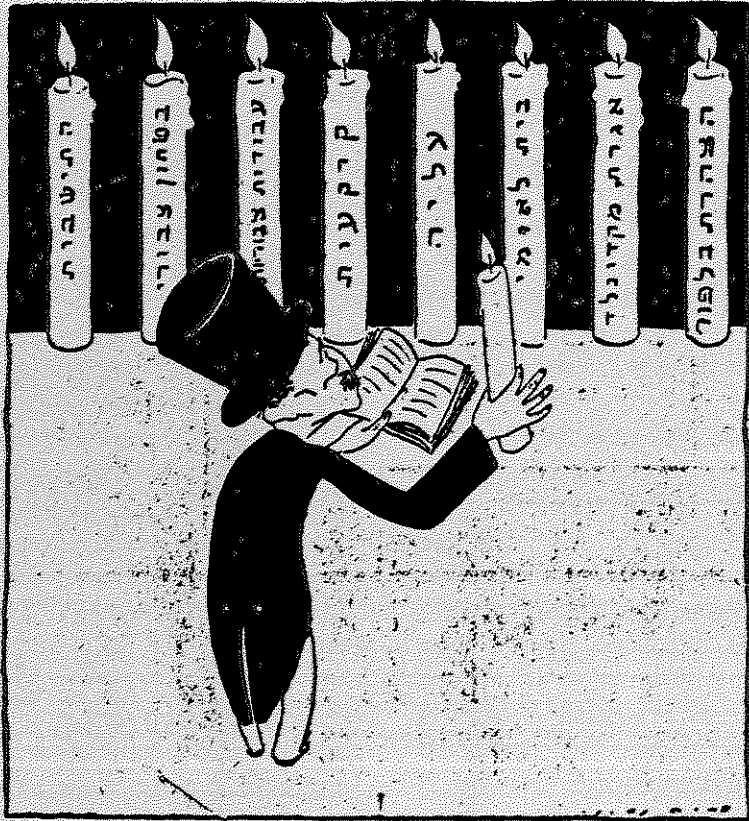
הגרות הללו קודש הם ואין לנו רשות להשתמש בהם אלא לראותם בלבד...